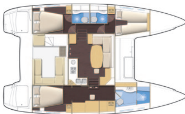
Version propriétaire, 3 salles d'eau Owner's version, 3 bathrooms