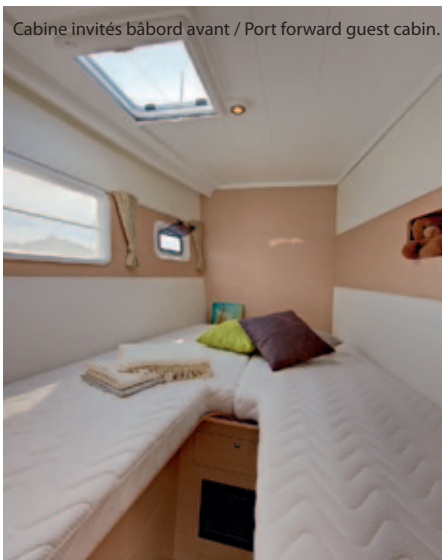
Cabine invités bâbord avant / Port forward guest cabin.

A tribordo, cabina amatoriale con scrivania.