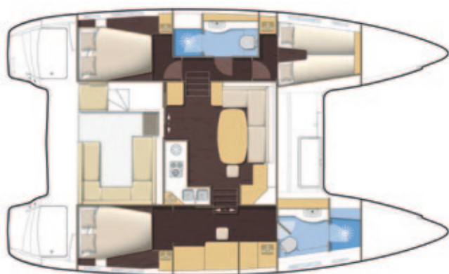
Version propriétaire, 2 salles d'eau Owner's version, 2 bathrooms

Comfort : equipped for long distance cruising, your Lagoon includes all the equipment required for a prolonged and distant cruise.