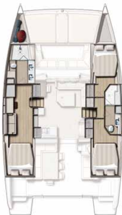
Version 3 cabins / 2 SDB 3 cabin version / 2 bath Versión 3 camarates / 2 cuartos de baños 3 Kabinen, 2 Bäder