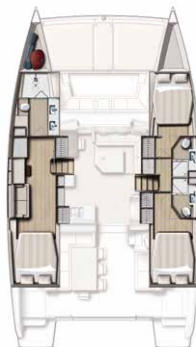
Version 3 cabins / 3 SDB 3 cabin version / 3 bath Versión 3 camarates / 3 cuartos de baños 3 Kabinen, 3 Bäder